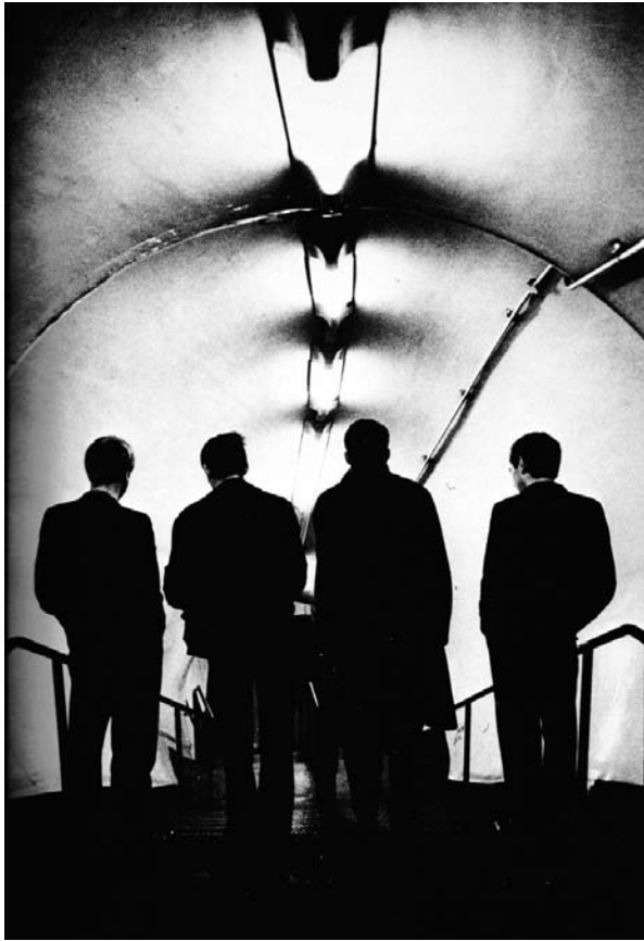
Den senere verdenskendte fotograf og instruktør Anton Corbijn's ikoniske foto af Joy Division i den engelske undergrund. Corbijn kom senere til at påvirke både U2's og Depeche Modes visuelle image.