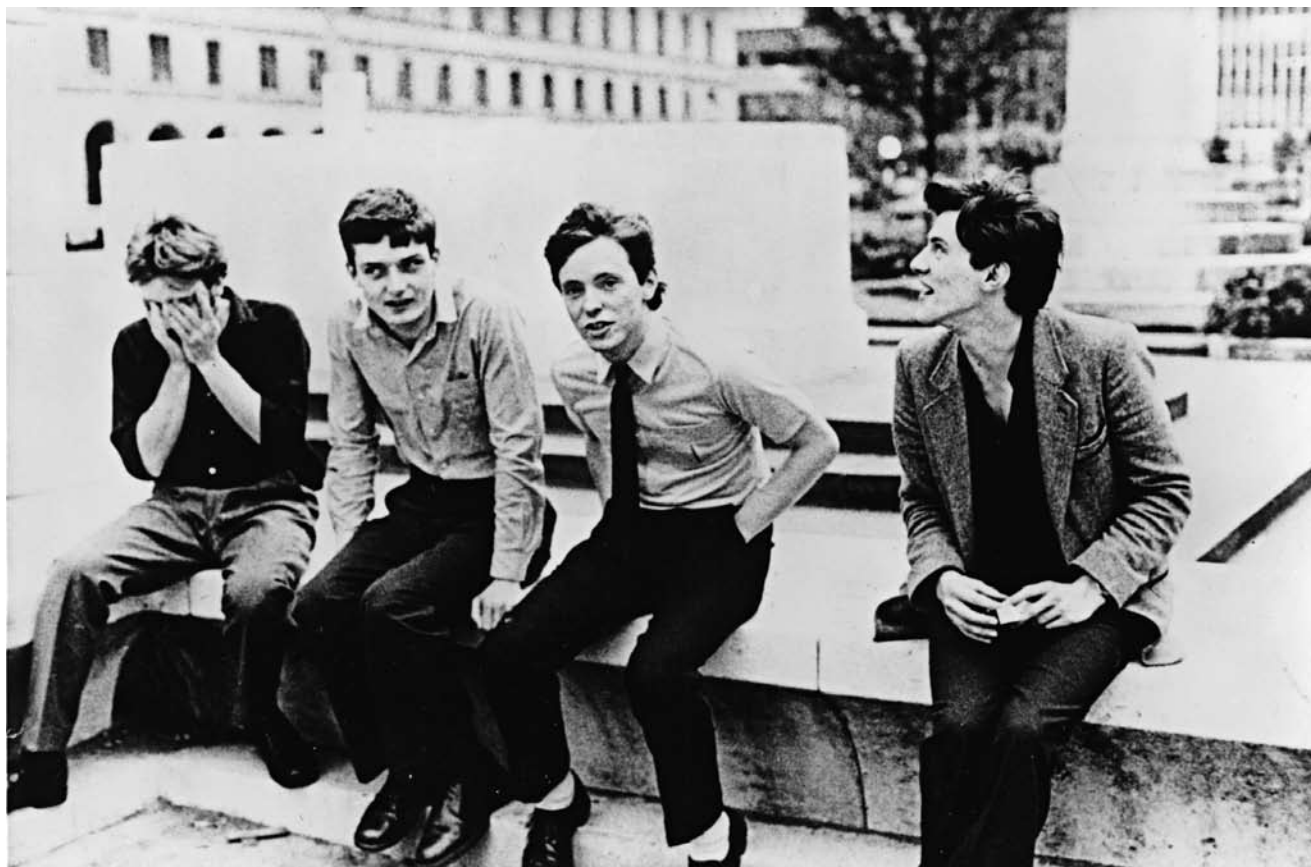
Efter glamrockens læbestiftsgraffiti og punkens skrigende hårfarver kom Joy Division, fire unge fyre i grå bukser, Lancashire-sko, nydeligt strøgne skjorter og slips. Hos Joy Division var der ingen gimmicks – det var alvor frataget al posering.